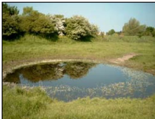
Figuur 1. Enkele voorbeelden van Belgische veedrinkpoelen die in deze studie werden bestudeerd.

en zoöbenthos, de macro-invertebratenfauna en het visbestand. Amfibieën werden in het veld geïdentificeerd en weer losgelaten. Van macroscopische waterplanten (macrofyten) is een inschatting gemaakt van de bedekkingsgraad; deze werden vervolgens ingezameld, gedroogd en in het laboratorium tot op soort geïdentificeerd. Het fytoplankton en de keverfauna werd