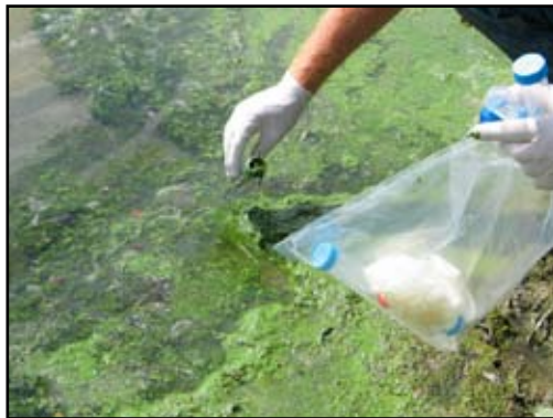
Figuur 5: Microcystisbloei in vijver van het natuurreservaat het Tens Broek