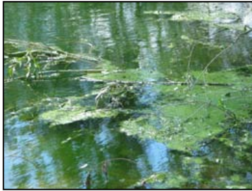
Figuur 4: Microcystisbloei in vijver van het natuurreservaat het Leeuwenhof in Drongen