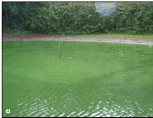
Figuur 3: Cyanobacteriën-bloeien van Microcystis in vijver in Westveldpark (St-Amandsberg) (a), Planktothrix agardhii in Klotkom (Brugge) (b) en Anabaena in visvijver (Grembergen) (c)

In totaal werden meer dan 100 cyanobacteriën-bloeien bemonsterd in meren, vijvers en poelen in België (voornamelijk in Vlaanderen) gedurende de zomers van 2003, 2004 en 2005. Tevens werden ook verschillende chemische (concentraties aan opgeloste nutriënten: nitraat, ammonium en orthofosfaat) en fysische parameters (o.a. temperatuur, lichtintensiteit, troebelheid, zuurstofgehalte en pH) bepaald in de bemonsterde waterlichamen. De voorkomende cyanobacteriënsoorten in de waterstalen werden gedetermineerd en